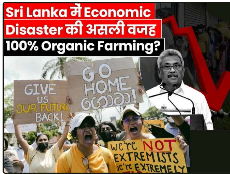
Οικονομική καταστροφή της Σρι Λάνκα