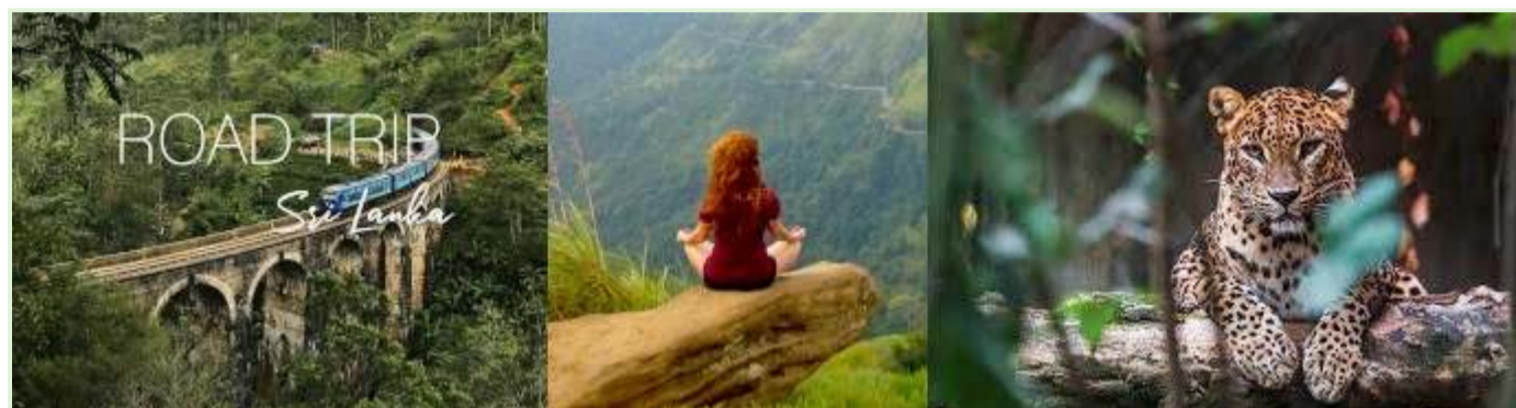
Διακοπές στη Σρι Λάνκα - Ξεναγήσεις στη φύση και αποστολές

Χρονοδιάγραμμα: Το πείραμα ξεκίνησε κατά τη διάρκεια της πανδημίας COVID-19, όταν η οικονομία της Σρι Λάνκα που εξαρτιόταν από τον τουρισμό είχε ήδη επηρεαστεί σοβαρά.